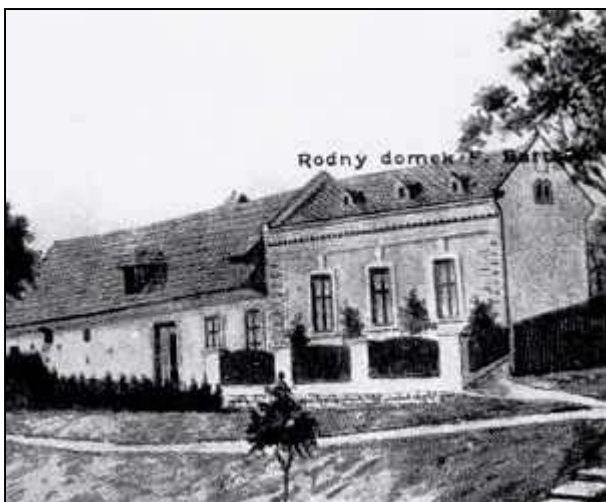
/Studijně-dokumentační středisko Františka Bartoše: Krajská knihovna Františka Bartoše ve Zlíně a Muzeum jihovýchodní Moravy ve Zlíně, Zlín 2006/